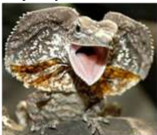
Agama límcová 1

... jeskynní medvěd žil na počátku čtvrtohor? Živil se výhradně rostlinnou stravou, ale přesto patřil k největším šelmám v tehdejší Evropě.