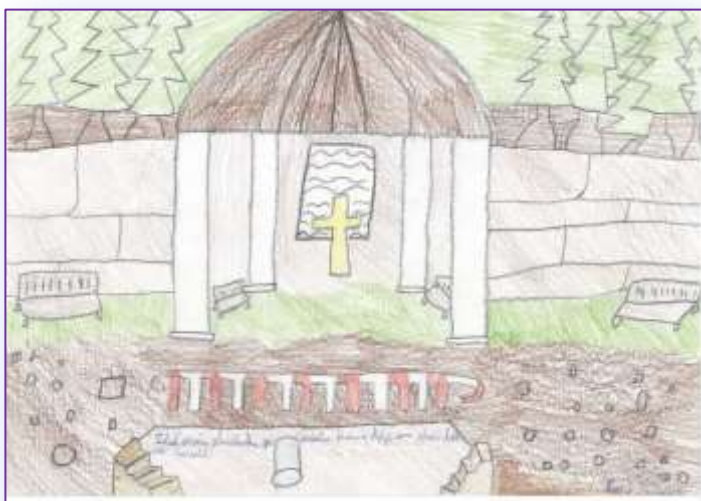
Zdislavinu studánku namalovala S.Ryšková