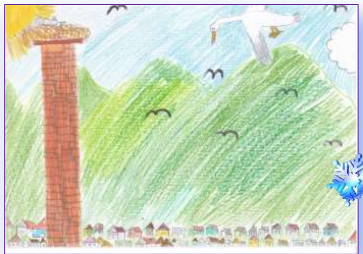
Čapí hnízdo namalovala: S.Drábová

Vydává Městská knihovna Jablonné v Podještědí, ww.knihovnajablonnevp.webk.cz