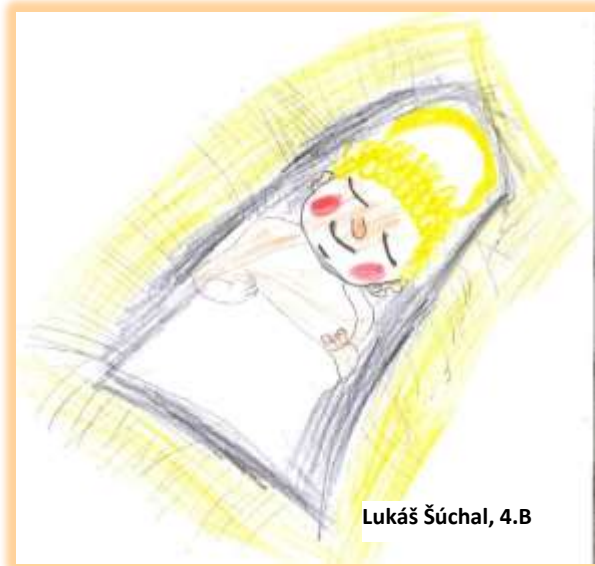
Lukáš Šúchal, 4.B